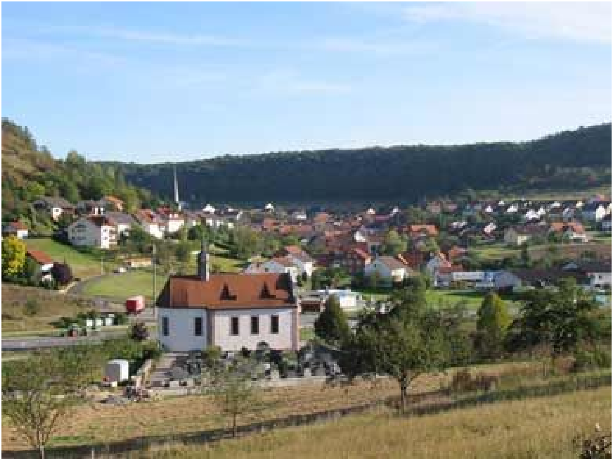
Pfarrkirche St. Valentin in Engenthal

Die äußerst schlichte, aber wohlgestaltete kath. Dorfkirche in Engenthal erfreut durch eine angemessene harmonische Inneneinrichtung. Interessant sind vor allem der Hochaltar mit seinem originellen handwerklichen Rokokoaufbau (um 1740) und die Figur des Schutzpatrons St. Valentin.