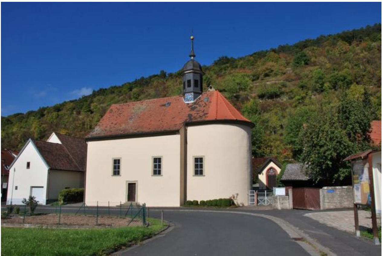
Pfarrkirche St. Vitus in Langendorf

Die äußerst schlichte, aber wohlgestaltete kath. Dorfkirche in Engenthal erfreut durch eine angemessene harmonische Inneneinrichtung. Interessant sind vor allem der Hochaltar mit seinem originellen handwerklichen Rokokoaufbau (um 1740) und die Figur des Schutzpatrons St. Valentin.